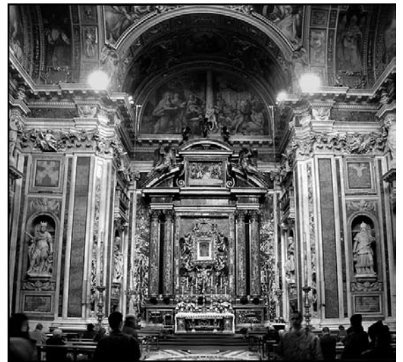
Santa Maria Maggiore

Het zou in dit kader een goed idee zijn om in ieder geval de wijding van de vierde pauselijke basiliek, de Santa Maria Maggiore, op te nemen in de lijst. De basiliek heeft een schitterend renaissance plafond waar het vakmanschap vanaf spat. Het vele goud geeft de zoldering bovendien een hemelse uitstraling, die, bij nader inzien, niet meer is dan de kleren van de keizer. Het goud is namelijk een schen-