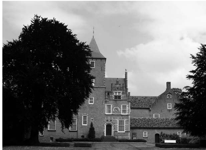
Klooster Catharinadal, Oosterhout

Dan komt er veel aandacht voor de vrijwilligers die de kerkelijke gemeenten draaiende houden. Voor hen zijn onder meer praktische cursussen en instructies ontwikkeld over wat men met kerkelijke roerende zaken wel mag doen en wat men moet laten. Denk aan zilverpoetsen en het gebruik van boenwas!