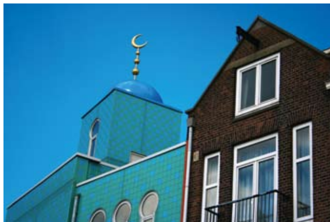
Moskee in Amsterdam.