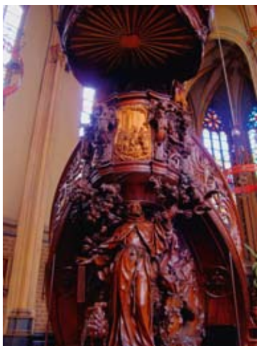
Kansel Nicolaasbasiliek, IJsselstein

Het Jaar RE, zoals het Jaar voor het Religieus Erfgoed in de wandeling heet, heeft twee doelen: de rijkheid, schoonheid en verscheidenheid van religieus erfgoed nog eens onder de aandacht te brengen, maar ook de zorg voor joods en christelijk erfgoed te benadrukken nu het aantal gelovigen terugloopt en kerken sluiten en fuseren. Veel kerken, ook protestantse, staan stampvol objecten. Sommige gemeenten hebben hun kwetsbare of waardevolle spullen ondergebracht in een museum, zoals de Waalse kerk in Delft en de Remonstrantse Gemeente in Gouda. Helaas heeft niet iedereen dat gedaan. Maar wat dan als de kerk wordt gesloten of fuseert met een andere? Dan ontstaat er een opeenhoping van bijbels, altaarkleden, gezangenborden, avondmaalstellen: spullen die niet meer in hun oorspronkelijke context staan, en die dus gemakkelijk weggegooid worden. De SKKN is dus in 2003 begonnen met de zogenaamde waardestelling van de kerncollecties, een hulp om te kunnen kiezen wat je wilt behouden. Die waardestelling geeft alleen een advies, maar