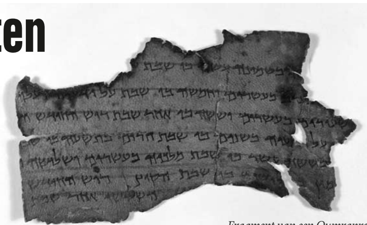
Fragment van een Qumranrol

Gelukkig zijn er ook andere manieren om dichterbij de originele tekst te komen. Ook in de oudheid werden de teksten namelijk al vertaald. Een aantal van die oude vertalingen is bewaard gebleven en deze zijn van groot belang om toch meer te weten te komen over hoe de tekst van het Oude Testament tussen 200 vóór en duizend na Christus er heeft uitgezien. Deze vertalingen zijn de Griekse vertaling (de Septuaginta), de Joods-Aramee vertalingen (Targoms), de vertaling in het kerk-Syrisch (een soort Aramees: de Pesjitta) en de Latijnse vertaling (de Vulgaat), die Hiëronymus tussen 390 en 405 uit het Hebreeuws heeft gemaakt. Door deze oude vertalingen 'terug te vertalen' naar het Hebreeuws, kan men een indruk