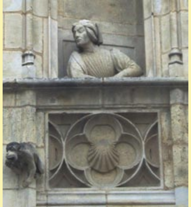
Palais Jacques-Cœur, Bourges, Frankrijk

We hebben al eerder gezien, dat de vierpas prima dienst kan doen als "fotolijstje": Zo tref je overal op het Palais Jacques-Cœur als verwijzing zijn naam St. Jacobsschelpen aan. Ik vermoed dat Jacques zelf hier op de uitkijk staat en dat de schelp een "naamplaatje" is – een pictogram dus eigenlijk.